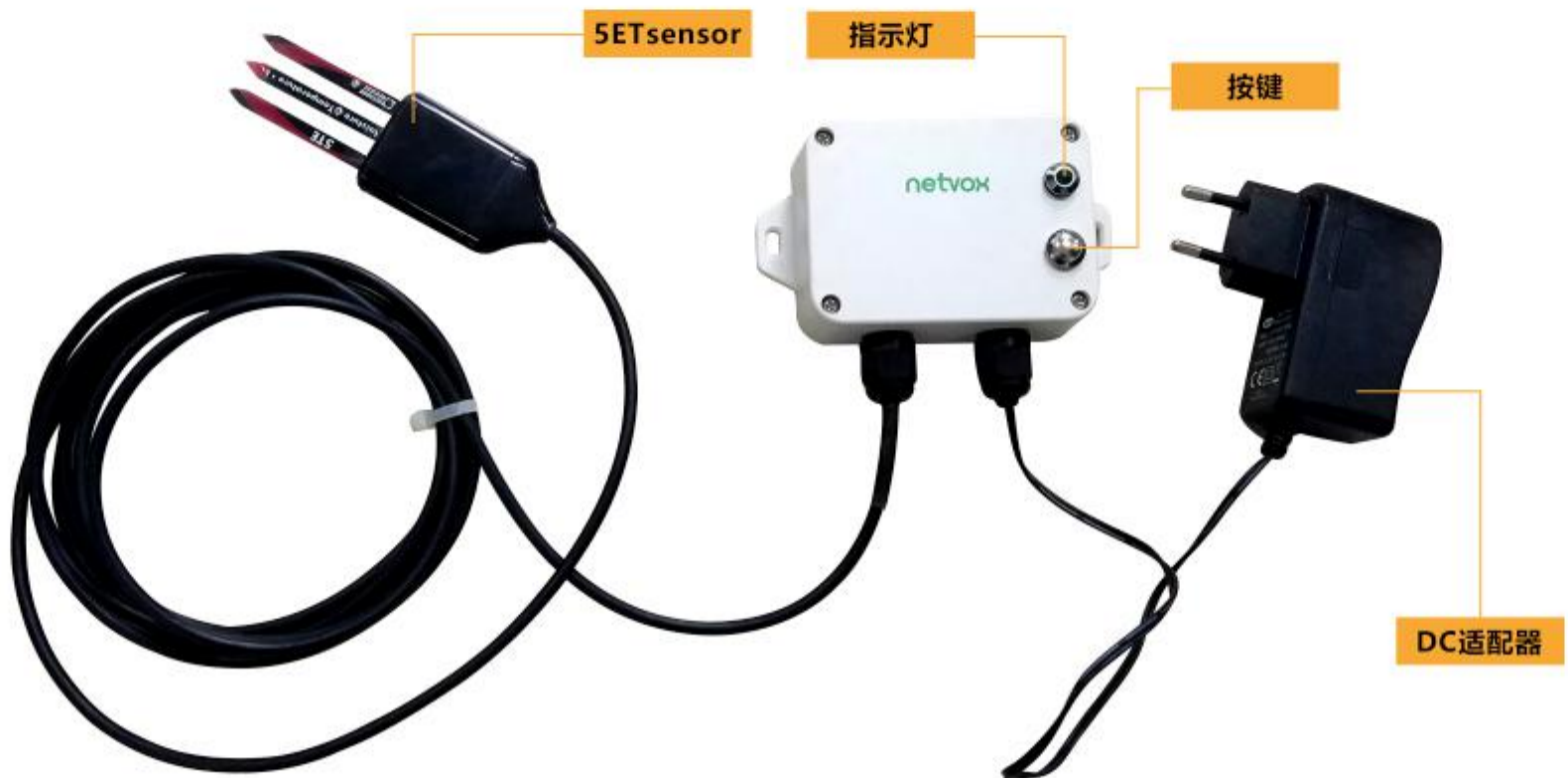
图一 R718PA14 外观图（以实物为准）